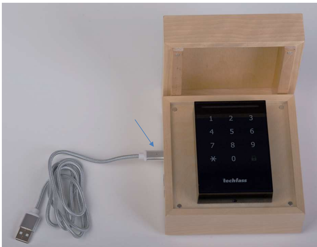
Obrázek 2: USB kabel musí být připojen do demo kitu LED diodou nahoru. Pokud je LED umístěna směrem dolů, tak demo kit je sice napájen, ale není schopen komunikovat s počítačem.