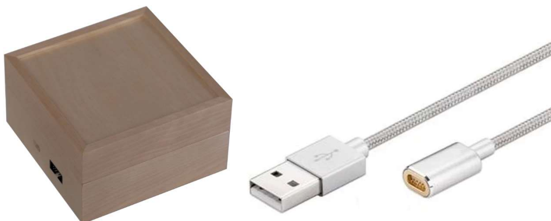
Obrázek 1: Demo Kit TF 120, který obsahuje magnetický USB kabel pro připojení k počítači.

Slouží k demonstraci funkcí a prezentaci výrobků, připojitelný k PC přes USB konektor pro napájení a data z aplikace APS Konfigurator.