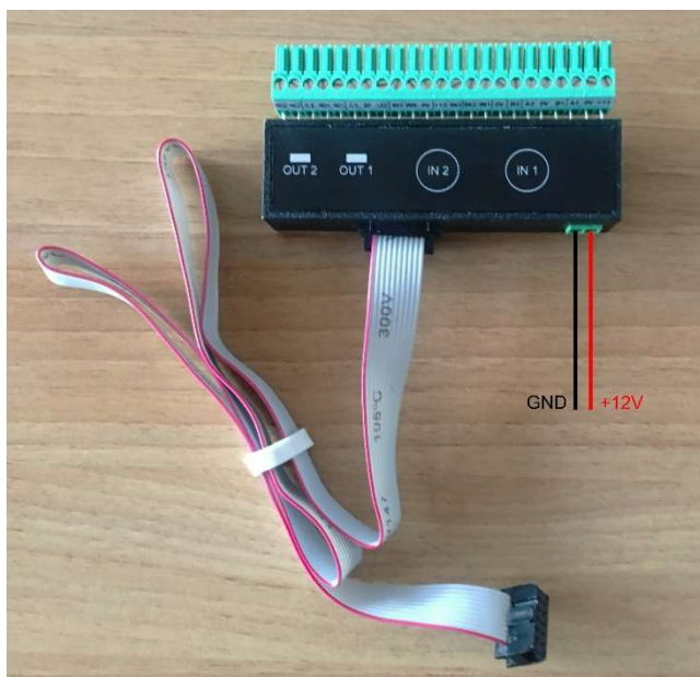
Obrázek 4: Kabel WGD k Demo Kitu TF 120