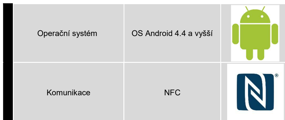
Tabulka 1: Požadavky na chytrý telefon pro verzi sw 0.60.

Aktuální verze aplikace TF Mobile ID 0.60. využívá pro přenos informací mezi čtečkou a mobilním telefonem komunikační technologii NFC. Tuto technologii zatím lze použít pouze u telefonů s operačním systémem Android od verze 4.4 (Kit Kat). Seznam vyzkoušených chytrých telefonů naleznete na www.techfass.com .