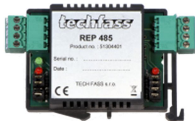
Obr. 1: Opakovač REP 485

Opakovač REP 485 je opakovač sběrnice RS 485 s galvanickým oddělením určený pro systémy APS mini Plus a APS 400 . Dodává se v provedení vhodném k montáži na DIN lištu.