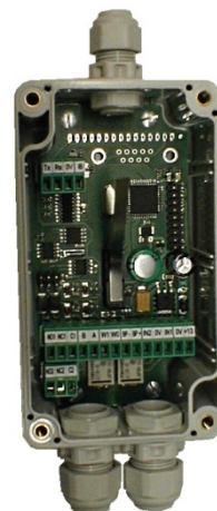
Obr. 1: NRIF 232-GP

Modul se připojuje na sběrnici APS BUS identifikačního systému APS 400, kde zabírá jednu adresu. K jednomu řídicímu modulu MCA 168 je možné připojit až 64 modulů NRIF 232-GP. Tyto moduly lze kombinovat i s ostatními moduly systému APS 400 na jedné lince.