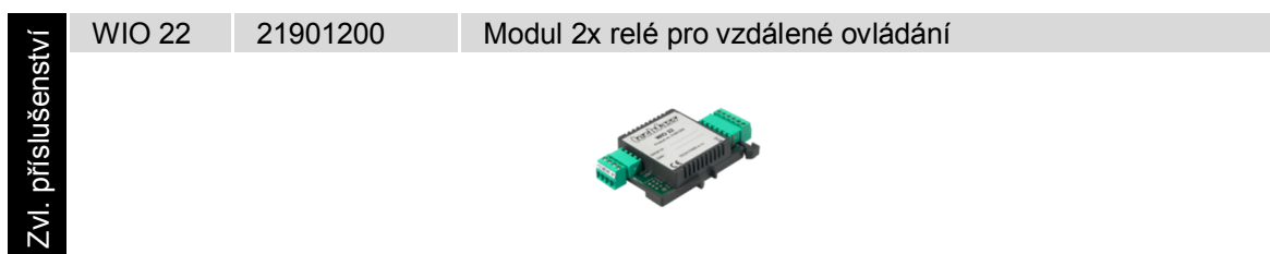
Tabulka 4: Zvláštní příslušenství