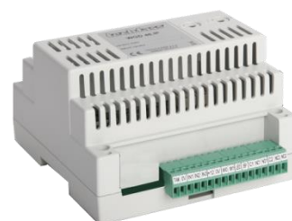
Obr. 1: MWGD 46LIFT

Tento modul systému APS mini Plus je určen pro ovládání výtahu, lze jej použít pro ovládání přístupu až do 4 podlaží. Pro načítání ID lze použít čtečku s výstupem WIEGAND známých světových výrobců s libovolnou čtecí technologií (obr. 1). Lze tak vyhovět požadavkům zákazníků na použití různých identifikačních technologií (HID Proximity, iCLASS, Mifare, Mifare DesFire, Indala apod.) a přitom využít všech předností systému APS mini Plus .