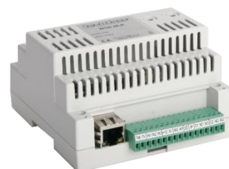
Obr. 2: MWGD 46LIFT.IP

Modul funkčně kompatibilní s předchozí verzí, navíc je osazen rozhraním pro přímé připojení na Ethernet pomocí TCP/IP protokolu (obr. 2). Na systémové lince tak může cenově i montážně výhodněji nahradit kombinaci modulu MWGD 46LIFT a převodníku RS 485 / TCP/IP.